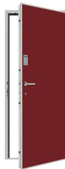
Diamant® Sérénité motorisée - Panneau plein

* possibilité de panneau en mélaminé pour porte palière